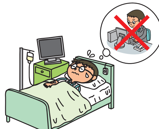
就業不能への備え (所得補償)