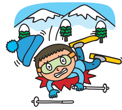
ケガへの備え (傷害補償)