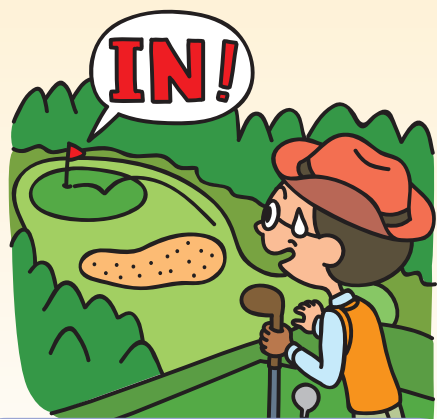
費用への備え (ホールインワン・アルバトロス補償)

高速道路の安全・快適を日々守られている皆様が、 安心してお仕事にお取り組み頂けるよう、創設された制度です。