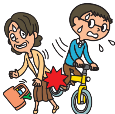
賠償責任への備え (個人賠償責任補償)