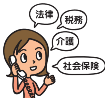
緊急医療相談・各種電話相談 (メディカルアシスト・デイリーサポート)