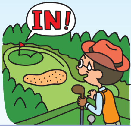
費用への備え (ホールインワン・アルバトロス補償)

高速道路の安全・快適を日々守られている皆様が、 安心してお仕事にお取り組み頂けるよう、創設された制度です。