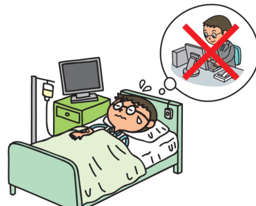
就業不能への備え (所得補償)