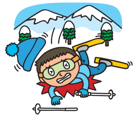
ケガへの備え (傷害補償)