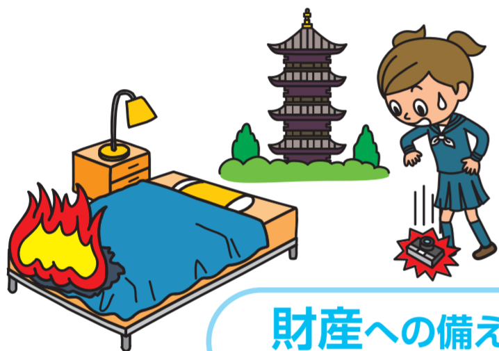
財産への備え (住宅内生活用動産・携行品補償)