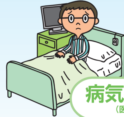
病気への備え (医療補償)